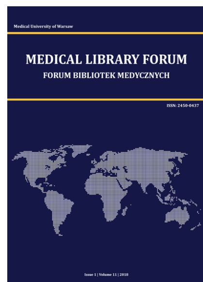
Fig. 1. The new cover, first used in the issue 1/2018

The papers began to be published under the standardised Creative Commons licence: BY-NC-ND. Since the authors are not charged for publishing, MLF has become a model example of a journal published in the diamond open access. Since 2021, the journal is indexed in the DOAJ (Directory of Open Access Journals) – a catalogue of open