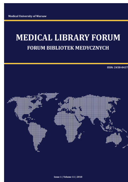
Il. 1. Nowa okładka czasopisma, obowiązująca od zeszytu 1/2018

Od pierwszych zeszytów z 2008 r. czasopismo współfinansowały następujące uczelnie: Collegium Medicum Uniwersytetu Mikołaja Kopernika w Bydgoszczy, Gdański Uniwersytet Medyczny, Uniwersytet Medyczny w Lublinie, Uniwersytet Medyczny w Łodzi, Uniwersytet Medyczny w Poznaniu, Pomorski Uniwersytet Medyczny, Warszawski Uniwersytet Medyczny, Uniwersytet Medyczny we Wrocławiu oraz przez Centrum Medyczne Kształcenia Podyplomowego. Po 10 latach działalności FBM grono instytucji współfinansujących periodyk poszerzyło się o Śląski Uniwersytet Medyczny, Collegium Medicum Uniwersytetu Jagiellońskiego, Uniwersytet Warmińsko-Mazurski i Uniwersytet Opolski.