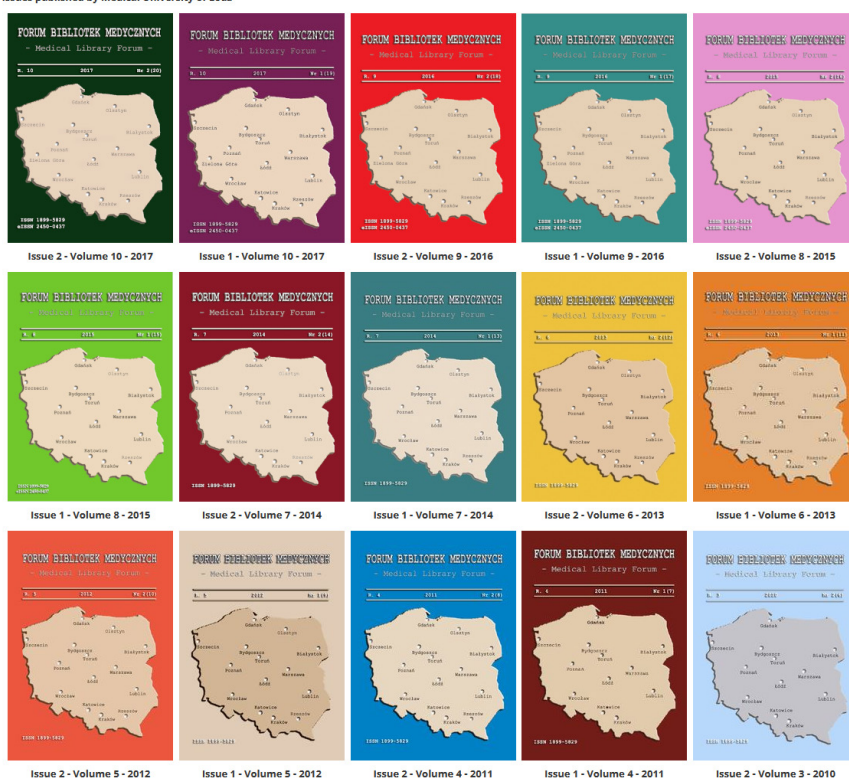
Fig. 3. Archive of the issues from the years 2008–2017

Issues published by Medical University of Łódź